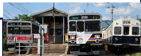
★並び写真イメージ 実際の撮影位置はこの写真より右側となり、上り線の電車と重なる各構造物の位置が異なります。